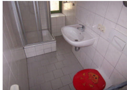
Zweitbad m. Dusche

Bei Mietvertragsabschluß entsteht unsererseits gegenüber dem Mieter ein Provisionsanspruch in Höhe von 0 Monatskaltmiete zzgl. Mehrwertsteuer. Alle Angaben nach bestem Wissen. Irrtum und Zwischenvermietung vorbehalten. Dieses Exposé ist eine Vorinformation, als Rechtsgrundlage gilt allein der Mietvertrag.