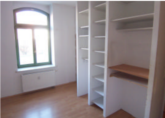
Raum m. Trennwand und Einbauten (optional)