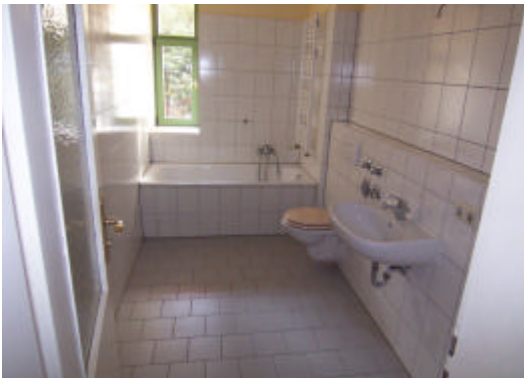
Bad m. Wanne