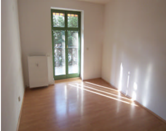
Schlafzimmer m. Zugang zur Terrasse

✉ iris.feistauer@t-online.de 🌐 www.feistauer-immobilien.de