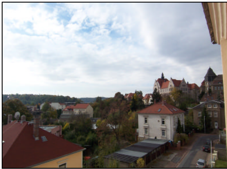
Blick aus dem Wohnzimmer

Bei Mietvertragsabschluß entsteht unsererseits gegenüber dem Mieter ein Provisionsanspruch in Höhe von 0 Monatskaltmiete zzgl. Mehrwertsteuer. Alle Angaben nach bestem Wissen. Irrtum und Zwischenvermietung vorbehalten. Dieses Exposé ist eine Vorinformation, als Rechtsgrundlage gilt allein der Mietvertrag.