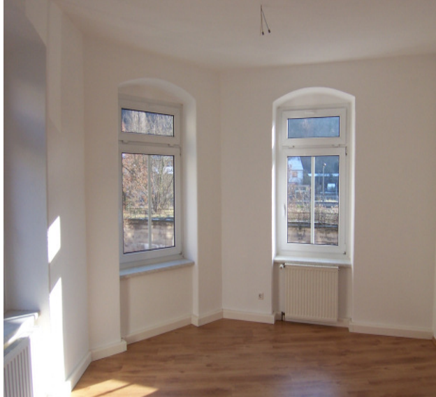
Wohnzimmer mit Erkerfenster