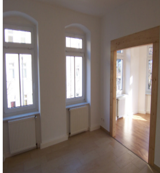
Küche m. Übergang zum Wohnzimmer