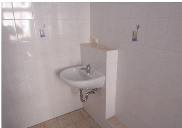
Waschtisch im Bad