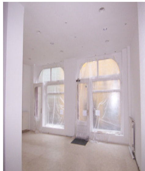
Laden m. Schaufenster

Bei Mietvertragsabschluß entsteht unsererseits gegenüber dem Mieter ein Provisionsanspruch in Höhe von 0 Monatskaltmiete zzgl. Mehrwertsteuer. Alle Angaben nach bestem Wissen. Irrtum und Zwischenvermietung vorbehalten. Dieses Exposé ist eine Vorinformation, als Rechtsgrundlage gilt allein der Mietvertrag.