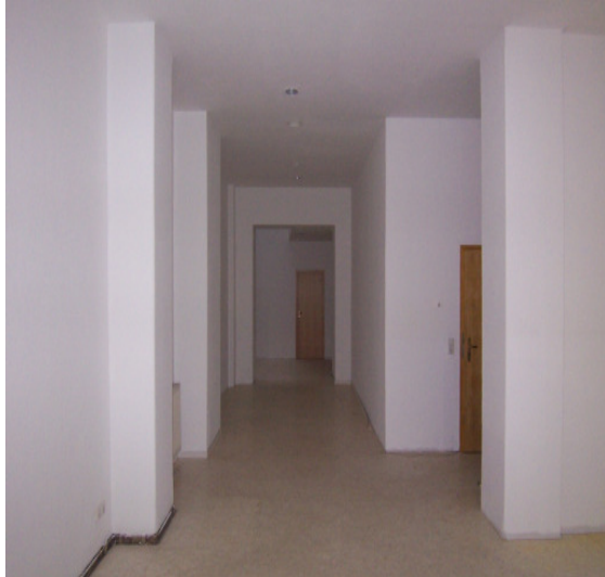
weitere Ladenfläche nach hinten

✉ iris.feistauer@t-online.de 🌐 www.feistauer-immobilien.de